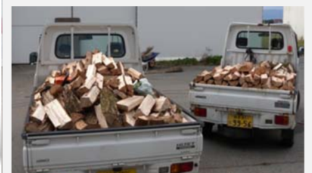
割った薪を持ち帰れます